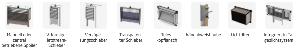
Manuell oder zentral betriebene Spoiler V-förmiger Jetstream-Schieber Verzögerungsschieber Transparenter Schieber Teleskopflansch Windabweishaube Lichtfilter Integriert in Tageslichtsystem