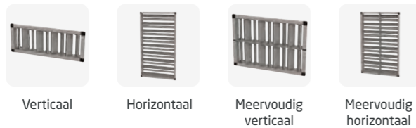
Verticaal Horizontaal Meervoudig verticaal Meervoudig horizontaal