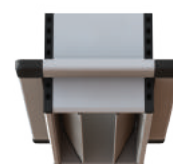
Dubbel met telescoopflens