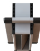
Enkel met telescoopflens