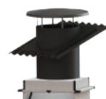
Dakkoker met PVH