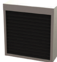
Staal zetwerk verzinkt