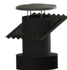
Dakkoker met LTR