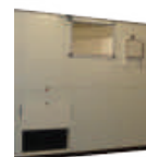
Schieber in Sandwichplatten-größe