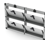
Trappes multiples avec volet droit