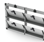
Meervoudige kleppen met rechte klep